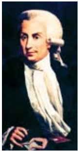
Wegbereiter der Elektrochemie: Luigi Galvani, 9.9.1737–4.12.1798, italienischer Arzt, Anatom und Biophysiker.

E lektromagnetische Felder sind in unserer modernen Zivilisation allgegenwärtig und nehmen laufend an Intensität zu. Gegenüber den schon immer vorhandenen natürlichen elektromagnetischen Feldern sind die künstlich erzeugten Felder in bestimmten Frequenzbereichen millionenfach stärker. Die Wissenschaft beschäftigt sich seit der Entdeckung der Elektrizität und dem Galvani-Versuch im 18. Jahrhundert am Froschschenkel mit der biologischen Wirkung elektromagnetischer Felder. Verstärkte Aufmerksamkeit erregte dieses The-